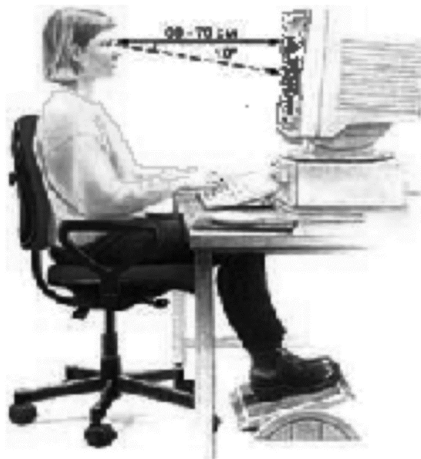
Рис. 2. Правильная посадка при работе за компьютером.