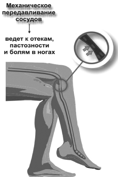
Рис. 3. Механическое передавливание сосудов.