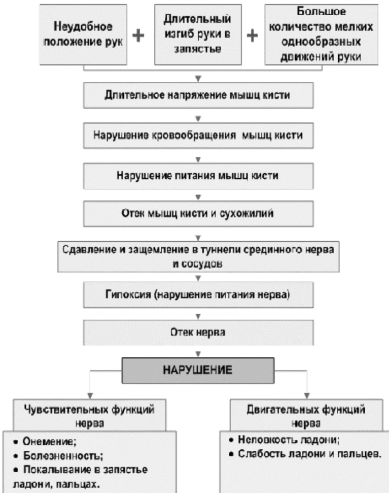
Рис. 5. Схема возникновения карпального синдрома.