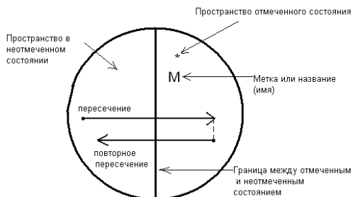
Рис.5. Иллюстрация закона пересечения.